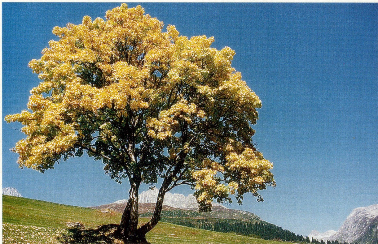
LESERFORUM-GALERIE - DAS BAUMFOTO IM OKTOBER