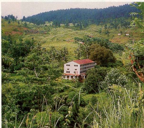
Bio-Teeanbau in Mischkultur (oben).