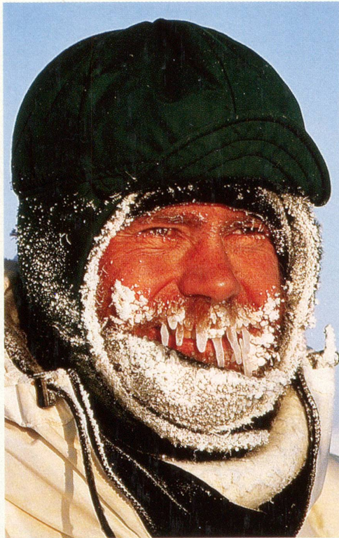
Wer hat wohl Lust, ihn aufzutauen?