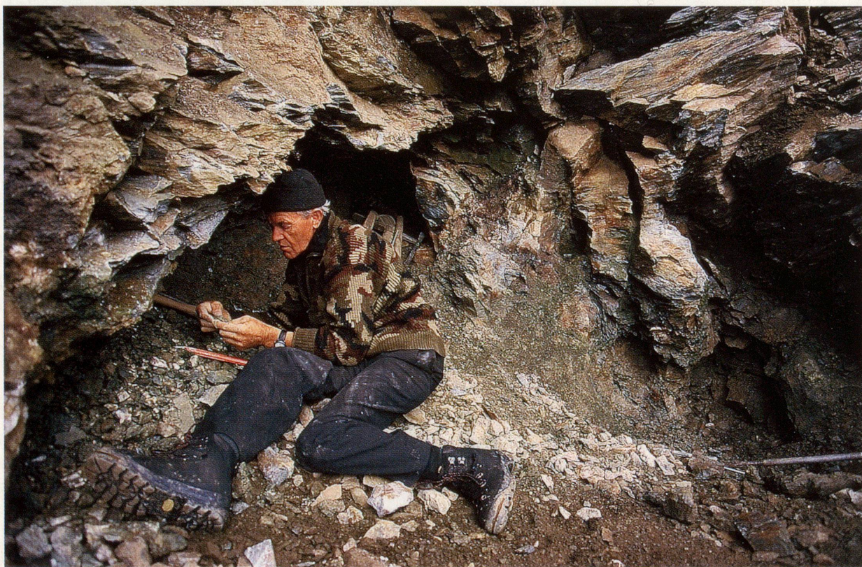
Ein Strahler inspiziert die Schätze einer soeben geöffneten Klufft.

Ihren zweiten Höhepunkt erreicht die Spannung schliesslich zu Hause, wo der Strahler nach gründlicher Reinigung, Umfang und Wert seiner Ausbeute genau abschätzen kann. Die gewonnenen Kristalle werden an Sammler und Touristen verkauft. Sammler und Kenner besuchen die jährlich im Herbst und Winter in der Schweiz stattfindenden Mineralienbörsen, auf denen viele schöne Stücke angeboten werden. Auch Museen und die Wissenschaft sind interessierte Abnehmer. Je nach Art und Qualität des Kristalls kann er mehrere tausend Franken wert sein, die anspruchsvolle Suche kann sich also wirklich bezahlt machen. Obwohl manch glücklicher Strahler kiloweise Kristalle ins Tal schleppt, wird es auch in Zukunft noch vielen passionierten Sammler gelingen, schöne Funde zu tätigen. Wenn auch in unserer Zeit keine neuen Bergkristalle in den Alpen mehr entstehen, weil weder Druck noch Temperatur in notwendiger Höhe vorhanden sind, sorgen doch Verwitterung und Erosion dafür, dass noch ei-