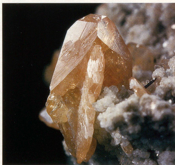
Titanit vom Lukmanier aus der Sammlung G. Venzin-Marty, Disentis

Schwingung gerät. Eine erfreuliche Entdeckung, denn ein solcher Schwingquarz konnte nun zur Kontrolle von Radiowellen und zur Regulierung in Quarzuhren verwendet werden. Quarzsand dient auch als wichtiger Rohstoff für die Glas- und Keramikindustrie. Durch die steigende Nachfrage der modernen Technologien nach reinen untadeligen Quarz- und anderen Kristallen, liegt es nahe, dass sich Wissenschaftler seit vielen Jahren darum bemühen, solch makellose Kristalle künstlich herzustellen, um somit ihre Grösse und Gestalt beliebig wählen zu können. Denn das aus Quarz mit Kohle gewonnene Silizium wird für die Elektronik verwendet, die inzwischen zu einer richtigen Kristalltechnologie geworden ist. Was wäre unsere Gesellschaft zum Beispiel ohne Notebooks, Kreditkarten oder Ferienfotos? In fast jedem elektronischen oder optischen Gerät, das wir benutzen, findet man künstlich gezüchtete Kristalle. Von ihrer Perfektion hängt also u. a. die weitere Entwicklung und Verbesserung der Elektronik ab. Die Kristalle haben die Menschen über sich viele Jahrtausende im Dunkeln gelassen, wäre es da nicht möglich, dass die scheinbar so durchsichtigen Prachtgebilde der Natur noch weitere Geheimnisse bergen, die vielleicht, wie viele gut gehüteten Geheimnisse, direkt vor unserer Nase liegen und uns zuglitzern? •KC