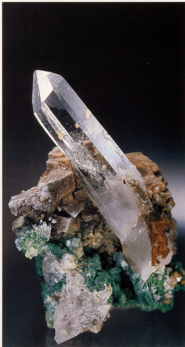
Der Glanz der Natur: Quarz auf Malachit und Siderit aus Cavradi. Sammlung M. Giger, Disentis

nen Kristall einfach abbrechen, nur um «wenigstens etwas» davon mitnehmen zu können. Lieber nimmt er stundenlange Arbeit auf sich, den Fels in handliche Stücke zu zerlegen, um die ausgewachsenen kristallisierten Mineralien möglichst schadlos zu bergen. Nun erreicht die Spannung ihren ersten Höhepunkt, denn noch kann der Strahler nicht genau abschätzen, welchen Umfang und Wert er in seinen Händen hält. Mit der nächst greifbaren Flüssigkeit, sei dies Eistee aus der Feldflasche oder Mineralwasser, wird ein besonders ins Auge stechendes Stück, als Test, mit vor Aufregung zitternden Händen, hastig vom Lehm und Schmutz befreit.