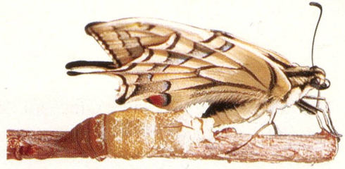
Schwalbenschwanz bei der Entpuppung

Sich mit Schmetterlingen befassen, bedeutet sich dem Wunder des Lebens hingeben. Ihre grazile Schönheit und ihr ungewöhnlicher Lebenswandel haben Menschen und besonders Kinder seit jeher begeistert. Mit geeigneten, vielfältigen Lebensräumen können wir die faszinierenden Insekten in unsere Nähe locken.