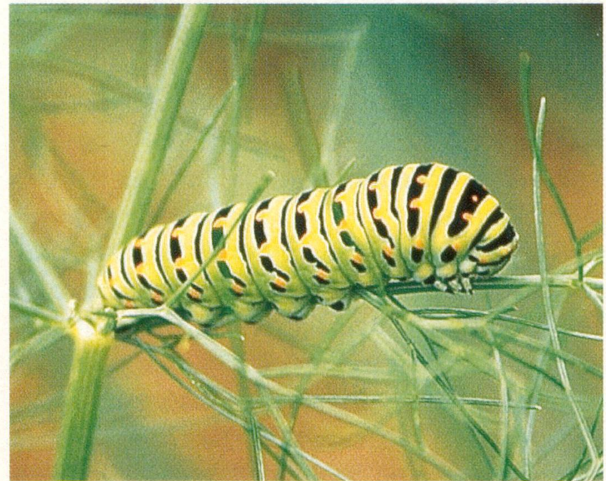
Raupe des Schwalbenschwanzes auf Fenchel

neration fängt mit der Eiablage an. Bei der Eiablage krümmt das Schmetterlingsweibchen den Hinterleib nach unten. Im Fall des Schwalbenschwanzes hält es sich kurz an der Pflanze fest und legt im Flatterflug ab. Diese Flugakrobatik bedingt einen lockeren Pflanzenbestand, in dem einzelne Individuen herausragen. Die Eier des Schwalbenschwanzes finden sich nur an zartem Grün, besonders an Sämlingen von Doldenblütlern wie Roskümme, Bibernelle oder Sämlingen der Wilden Möhre. Ob die Möhre ein «Rüebli» ist und in unserem Garten steht, spielt dem Schwalbenschwanz hingegen keine Rolle. Auch mit Fenchel – einem weiteren Doldenblütler – lässt sich der Schwalbenschwanz zur Eiablage bewegen, Hauptsache, die Pflanze kann im Flatterflug erreicht werden.