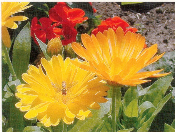
Reizvolles Detail aus dem A. Vogel-Schaugarten

Oberhalb des als Biedermeierdorf bekannten Kurortes Heiden im Appenzeller Vorderland liegt das traditionsreiche Mineralbad Unterrechstern, das nach seiner Neugründung im September 1982 nun mit Stolz sein 20-jähriges Jubiläum begeht. Neben dem qualitativ hervorragenden Heilwasser im Schwimmbad und an der Trinksäule verfügt die Anlage über zahlreiche weitere Attraktionen im Wellness- und Fitnessbereich, deren hohe Qualität das Gütesiegel «Q» von Schweiz Tourismus belegt. Neben Freiluft-Sonnenterrasse, Solarium, Sauna, Finarium und Fusspflegestudio ist das vielseitige Kursangebot mit Bodyforming, Gymnastik, Aquafit, Walking, Joggen und natürlich Schwimmen ein häufig und gern genutzter Anziehungspunkt für die Besucher, wobei sich Spinning (ein intensives Ausdauer- und Kreislauftraining auf speziellen Indoor-Bikes zu fetziger Musik) als eigentlicher Renner erwies. Bei den Besuchern sehr beliebt sind auch der von Heiden nach Unterrechstern (und weiter bis nach St. Anton) führende Gesundheitsweg, der altbewährte Heilverfahren aufzeigt, sowie der 1994 angelegte Alfred-Vogel-Heilpflanzengarten. Die Zukunftspläne des Mineralbads