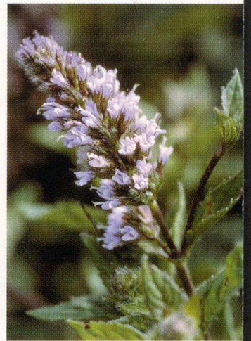
Pfefferminze ( Mentha piperita )

Wirksamkeit einer 10%igen Pfefferminzöllösung mit der von Placebos, Paracetamol und Acetylsalicylsäure (ASS) verglichen. Es zeigte sich, dass das Pfefferminzöl, bei Spannungskopfschmerzen auf Stirn und Schläfen aufgetragen, im Vergleich zum Placebo die Schmerzen signifikant reduziert. Dabei war die Wirkung mit der von Paracetamol und ASS vergleichbar. Auch bei Schulkindern erwies sich das Pfefferminzöl als ebenbürtige Alternative zu den herkömmlichen Schmerzmitteln. Nur bei Migränepatienten konnten weder Paracetamol noch Pfefferminzöl die Attacken wesentlich beeinflussen. Medical Tribune