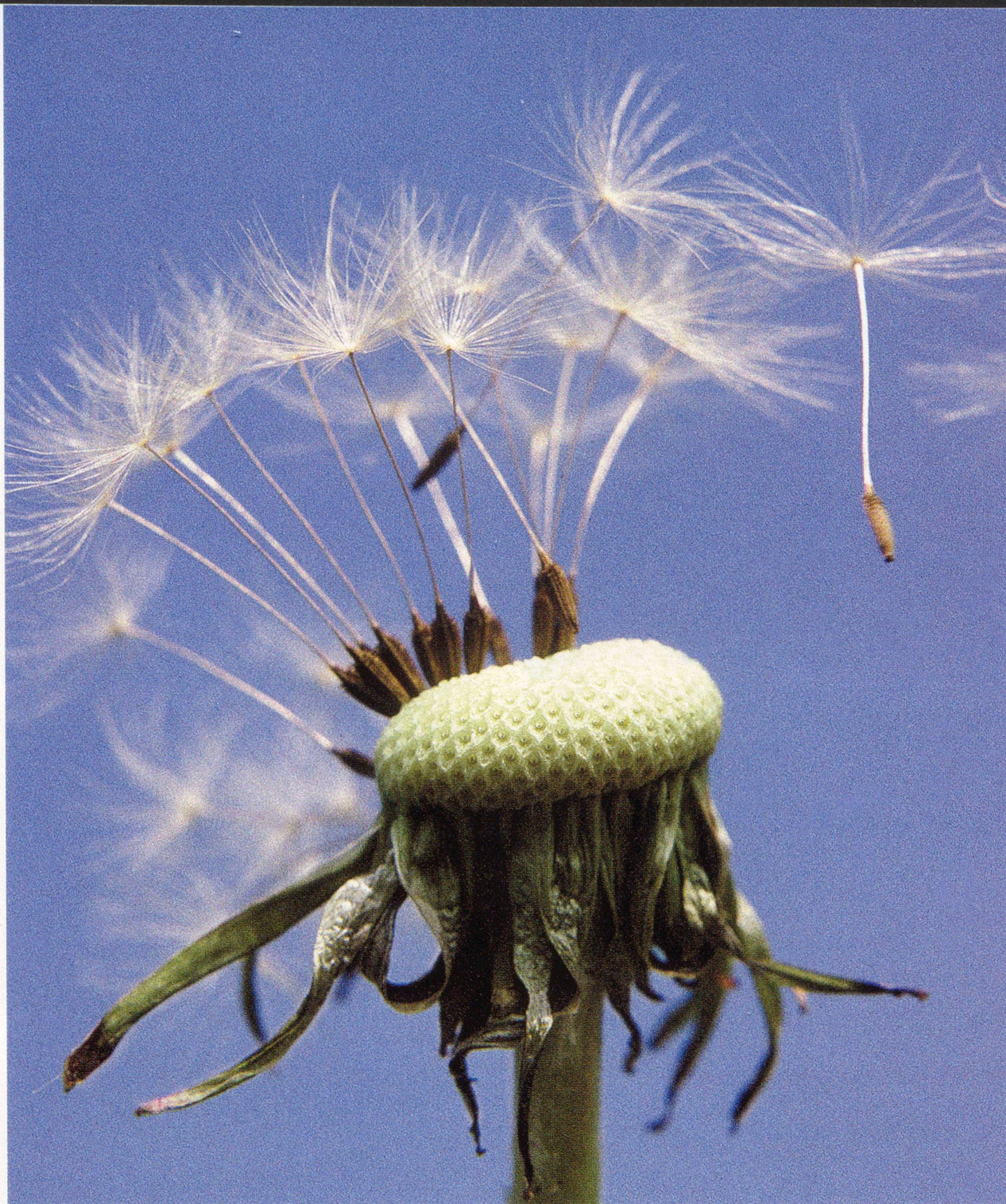
Bild des Monats – (Über-)lebenskünstler: Der Löwenzahn ( Taraxacum officinale ) schickt seine Samen weit in alle Welt.