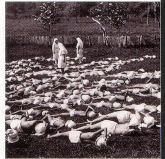
Heliotherapie Ende des 19. und zu Beginn des 20. Jahrhunderts: In einer Schweizer Tuberkulose-Klinik nehmen Mädchen auf der Wiese ein Sonnenbad.

Infrarotstrahlen, die unsicht-, aber fühlbaren Wärmestrahlen, wirken durchblutungsfördernd und regen den Stoffwechsel im Muskelgewebe an. Sie sind wohltuend und schmerzlindernd bei allen Erkrankungen des Bewegungsapparates, bei denen Wärme gut vertragen wird, oder bei anderen chronischen Entzündungen, beispielsweise der Nasennebenhöhlen.