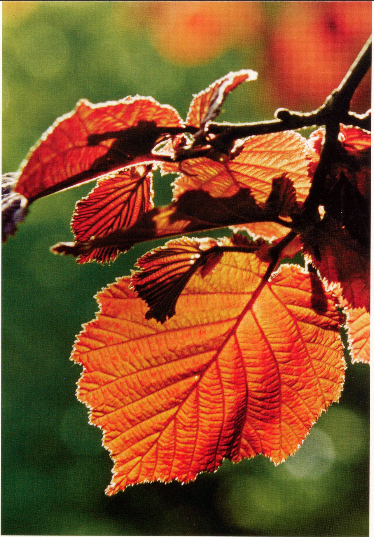
Bild des Monats – Ganz nah: Der Haselstrauch ( Corylus avellana )