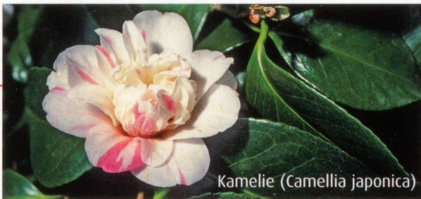
Kamelie (Camellia japonica)