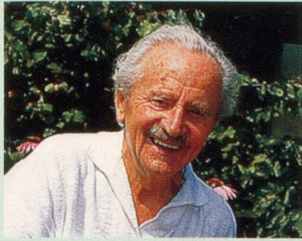
Alfred Vogel (1902 – 1996)