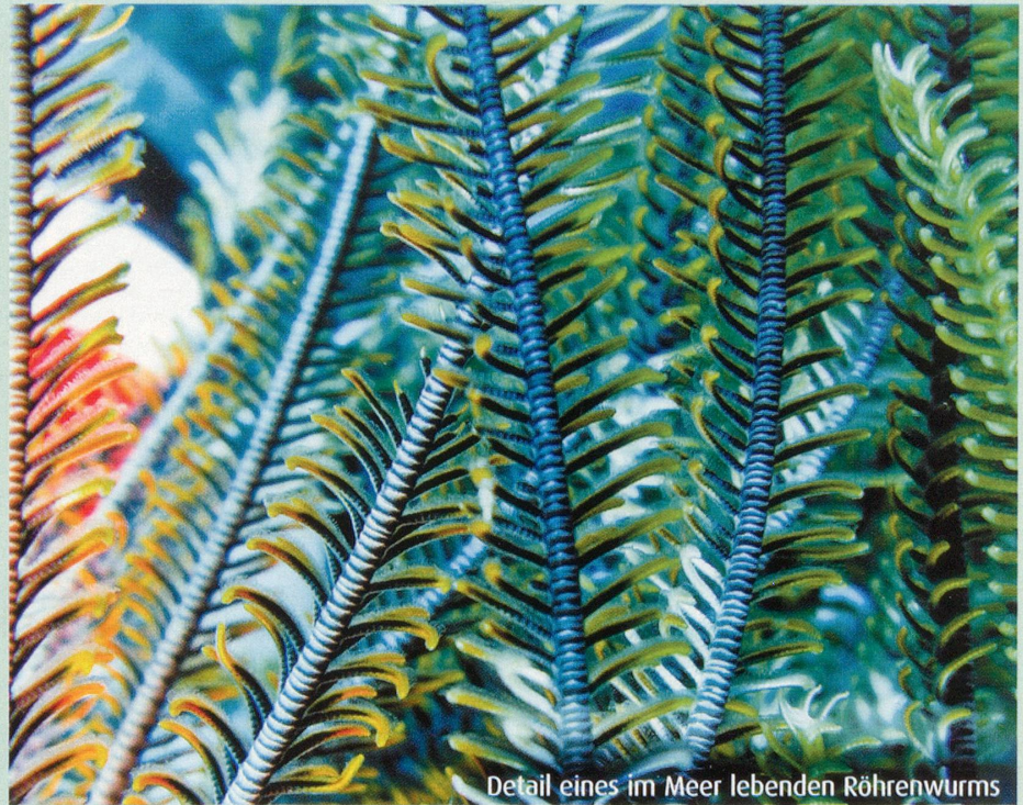
Detail eines im Meer lebenden Röhrenwurms

Das Baden im Meer wird in verschiedener Weise wohltuend auf uns einwirken. Alfred Vogel