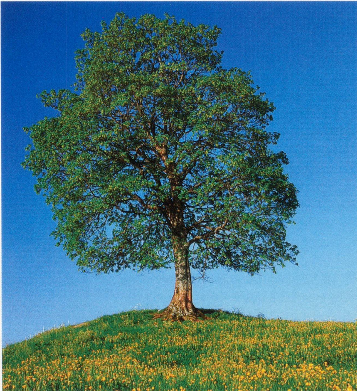
Der Bergahorn ( Acer pseudoplatanus ) kann über 30 Meter hoch und über 500 Jahre alt werden.