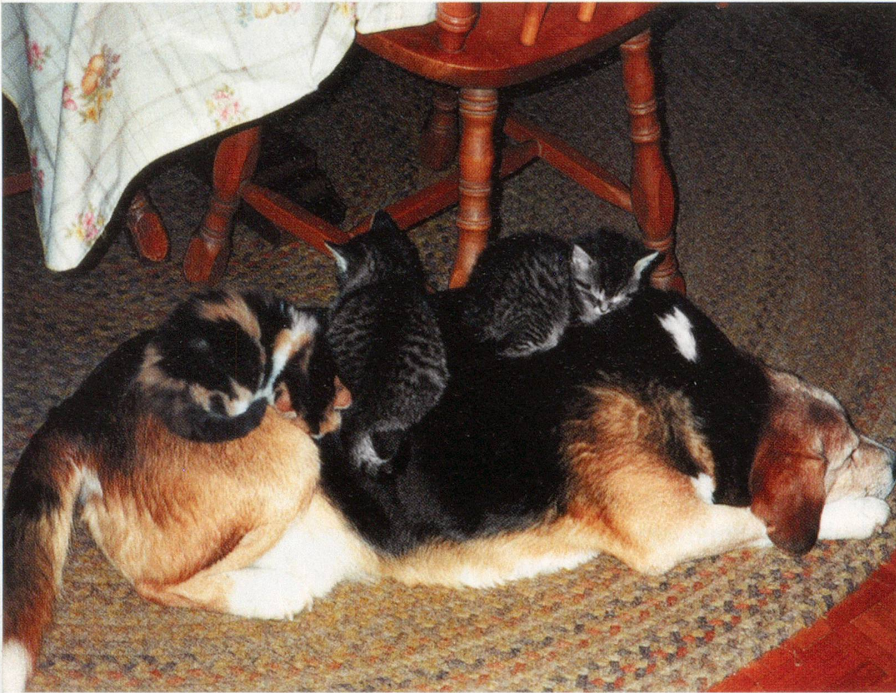
Leserforum-Galerie «Haustiere»: Gemütlich kuscheln mit grossem Hund und drei kleinen Katzen! Dieses herzige Foto schickte uns Ottilia Mathis aus Kanada.