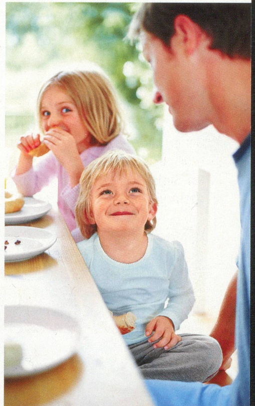
Gut für Kinder und ihre Gesundheit: Gemeinsame Mahlzeiten mit der ganzen Familie.