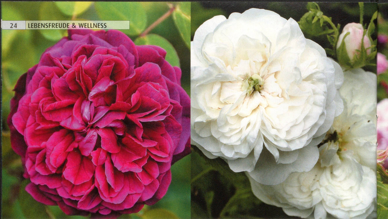
Die unkomplizierte «Rose de Resht», links, und die reichblühende weisse «Madame Hardy» sind eine Zierde für jeden Garten.

Marzipan. In der orientalischen Küche werden aber auch andere Speisen und Getränke damit aromatisiert, zum Beispiel Milchpudding und Cremes, Sorbets und Lassi. In der Hautpflege gilt es als reinigend und belebend und soll aufgrund seiner adstringierenden Eigenschaften die Poren verkleinern und so für einen schönen, zarten Teint sorgen. Seinen klaren, feinen Duft hat echtes Rosenwasser dem Stoff 2-Phenylethanol zu verdanken. Dieser kann den Magen-Darm-Trakt reizen; daher sollte man Rosenwasser nie pur trinken, sondern beim Kochen nur in kleinen Mengen verwenden.