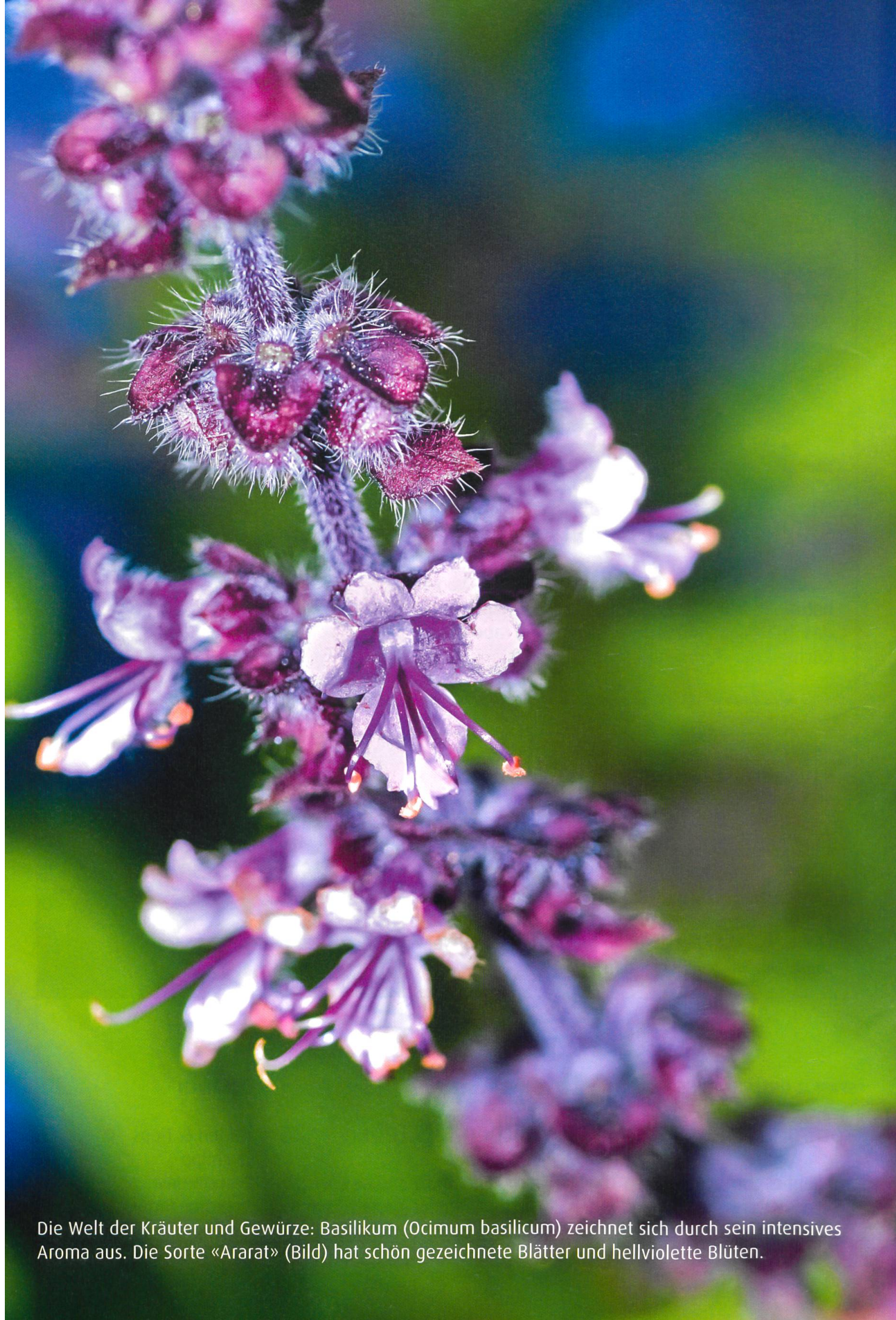
Die Welt der Kräuter und Gewürze: Basilikum ( Ocimum basilicum ) zeichnet sich durch sein intensives Aroma aus. Die Sorte «Ararat» (Bild) hat schön gezeichnete Blätter und hellviolette Blüten.