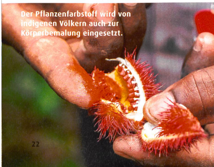
Der Pflanzenfarbstoff wird von indigenen Völkern auch zur Körperbemalung eingesetzt.

Zu guter Letzt noch ein Hinweis für Gesundheitsbewusste: Eine «Wunderfrucht» – denn als solche wird die Baumfrucht wie so viele andere bereits im Internet angepriesen – ist Annatto ganz sicher nicht. Zwar zeigen Auszüge aus Blättern und Blüten einen gewissen antibakteriellen Effekt, auch eine harntreibende Wirkung ist wahrscheinlich. Beides gilt jedoch auch für viel besser erforschte und meist heimische Pflanzen. Und die Wirkung der speziellen Vitamin-E-Form delta-Tocotrienol wird erst in allerersten Ansätzen untersucht. ●