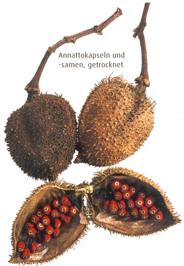
Annattokapseln und -samen, getrocknet

Versuchen Sie es einmal beim Gewürzhändler Ihres Vertrauens, der Ihnen die dreieckigen Samen vielleicht auch anderswoher besorgen kann, wenn er sie nicht selbst führt. Im Internet wird Annatto nicht selten angeboten, doch auch hier sollte man auf die Seriosität des Händlers achten. Insbesondere bei