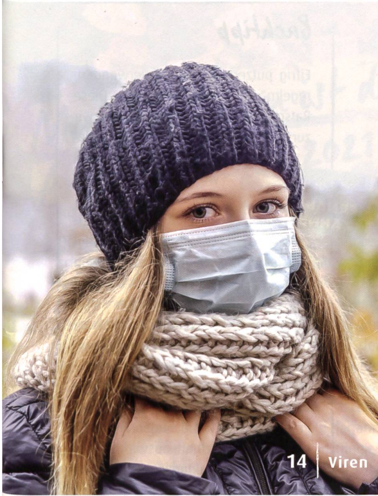
14 | Viren