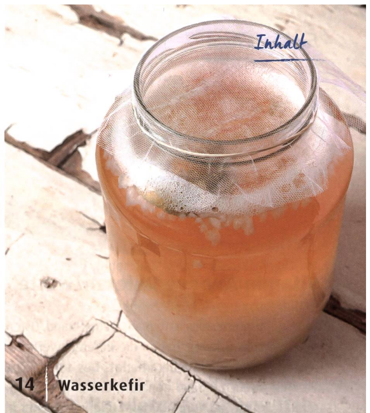
14 | Wasserkefir

Landwirtschaft ohne synthetische Pflanzenschutzmittel? Biobauern machen vor, dass es geht. Was ihre Strategien sind, was das für unsere Ernährung bedeutet und wie sich diese Vorgehensweise auf die Umwelt auswirkt. — Natur & Umwelt