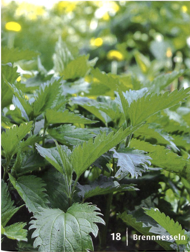
18 | Brennnesseln