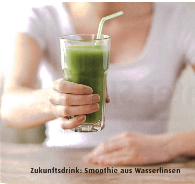
Zukunftsdrink: Smoothie aus Wasserlinsen