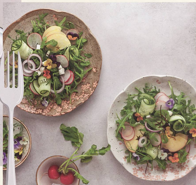
Ernährung abgestimmt auf die Jahreszeit: gut gegen Beschwerden.

Blockaden und Störungen kommen, die wiederum Krankheit auslösen können.