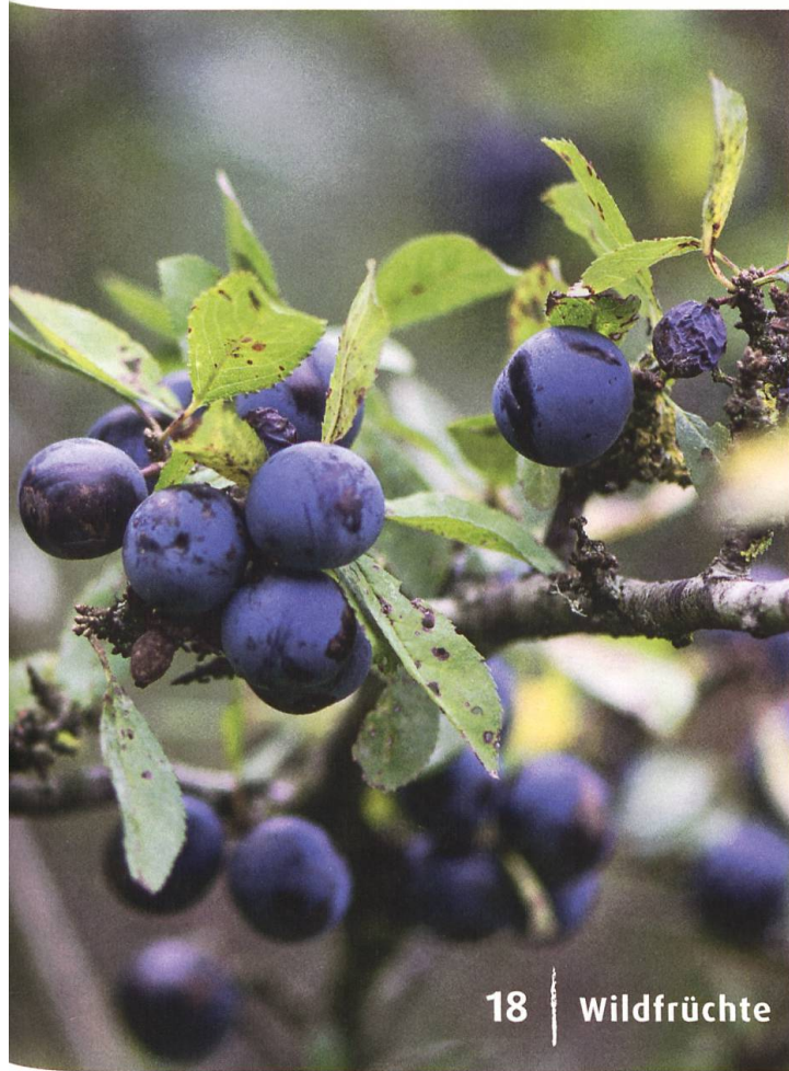
18 | Wildfrüchte