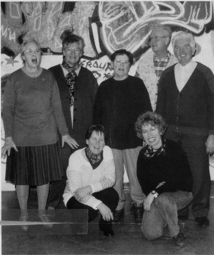
Auch Lieder sind Erinnerungsträger ...

ihr eine Behandlung zu empfehlen. Das Experiment war lehrreich, lustig und spannend – kurz: ein Realitätstest!