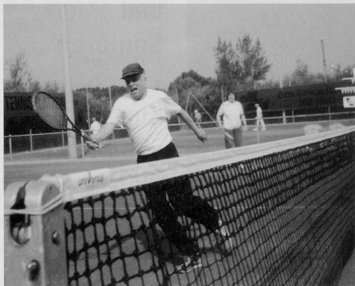
Mit Leidenschaft . . .

NS. Tennisfieber auch in Illnau-Effretikon: Mit sportlichem Elan griffen in der zweiten Juli-Woche acht Frauen und sechs Männer im Alter von 50 bis 70 Jahren zum Tennisschläger, um im A+S-Wochenkurs «50 plus» der Pro Senectute Kanton Zürich auf den Sandplätzen des Tennis-Clubs Illnau-Effretikon, die faszinierende Technik mit dem kleinen gelben Ball zu erlernen.