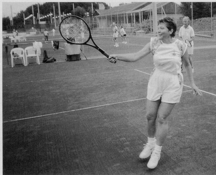
Schwung und Eleganz werden die Bälle erlaufen.

liger sorgt dafür, denn für jeden Tag hat er einen neuen Spruch auf Lager.