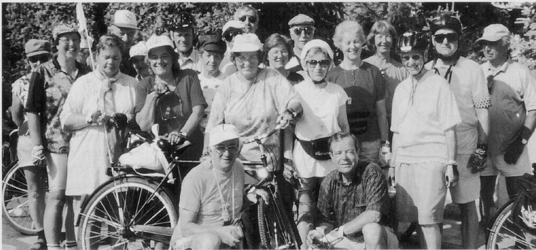
Gute Stimmung bei den 27 radelnden Frauen und Männer.