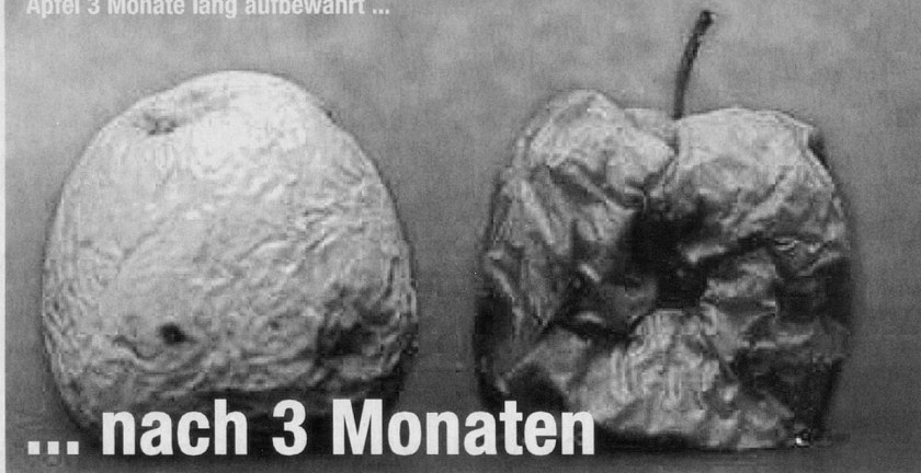
Der linke Apfel wurde nur mit ionisiertem Korallen-Wasser besprüht, der rechte Apfel wurde nicht besprüht und anschliessend wurden beide Äpfel 3 Monate lang aufbewahrt ...

Sango-Korallen bildeten einst die Insel Okinawa. Regenwasser sickert durch diesen prähistorischen, versteinerten Korallenberg und wäscht dabei Mineralien und andere Elemente heraus. Dieses Wasser ist wirklich einmalig. Es beinhaltet nicht nur viele lebenswichtige Mineralien, sondern einen grossen, weltweit einzigartigen Teil an ionischem organischem Kalzium .