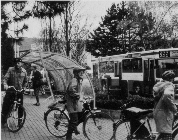
Fahrpraxis in Dietikon