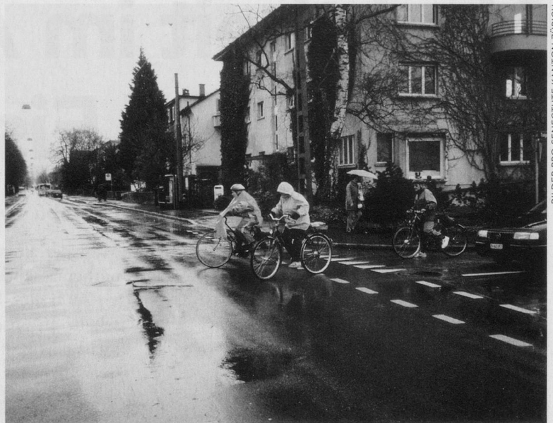
BILDER PRO SENECTUTE KANTON ZÜRICH

Sicherheit – dieses Ziel haben sich die Leiterinnen und Leiter der Pro Senectute-Velogruppen in Dietikon, Uster und Winterthur gesetzt und die Velosaison 2000 mit einem Velofahrkurs gestartet. Unter kompetenter Leitung von Fachpersonen aus der Polizei und der IG Velo Schweiz informierten sich an den drei Kursorten je 15 bis 20 Velofahrerinnen und Velofahrer über das sichere Verhalten im Verkehr. Nach einer theoretischen Einführung folgte eine intensive Fahrpraxis am Kursort. Viele Teilnehmende konnten dabei feststellen, dass in jüngster Zeit Verkehrsregeln und Routenführung für Velofahrerinnen und Velofahrer