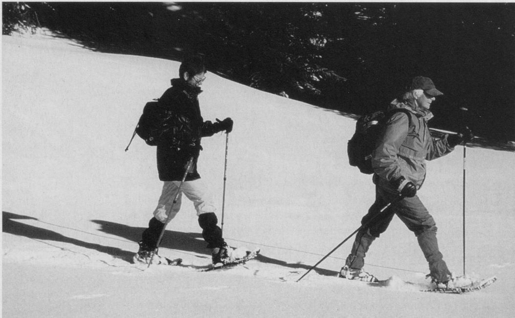
Neues ausprobieren: zu Beginn war das Schneeschuhwandern noch etwas ungewohnt, doch schnell hatten wir alles im Griff.