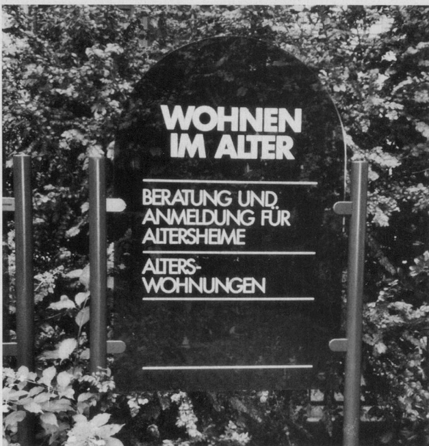
Wohnen im Alter: Kompetente Beratung für Menschen, die den Eintritt ins Alterheim planen.