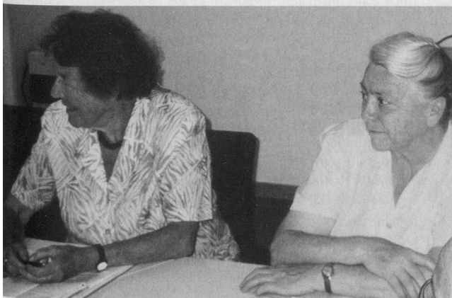
den «Aktion S»-Veranstaltungen ist Mitdiskutieren erwünscht.