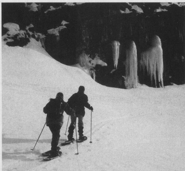
Schritt für Schritt durch die schnee-verzauberte Landschaft – auf Schneeschuhen lässt es sich träumen.