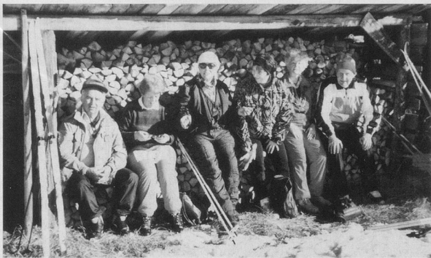
Auch Ruhe und Entspannung gehören zum Langlaufsport.

Der erste eigentliche Ferientag begann trüb, mit leichtem Schneefall, aber schon gegen Mittag zeigte uns eine strahlende Sonne die Gegend in ihrer winterlichen Pracht. So sollte das Wetter die ganze Woche bleiben, abwechslungsreich, mit einigen Kapriolen, aber doch mit viel Sonnenschein und Wärme. Nach der Einteilung in vier Gruppen begaben sich die einzelnen Klassen ins Olympia-