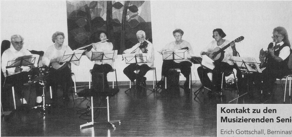
FOTO MUSIZIERENDE SENIOREN ZÜRICH

Idealbesetzung wären 12 Musizierende: Zum Wohlklang für alle werden begeisterte Musiker/innen gesucht.