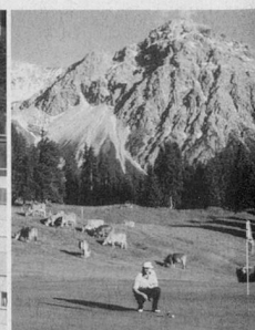
Aktive Ferien oder beschauliches Betrachten der Bergwelt: Arosa erfüllt verschiedene Ansprüche.