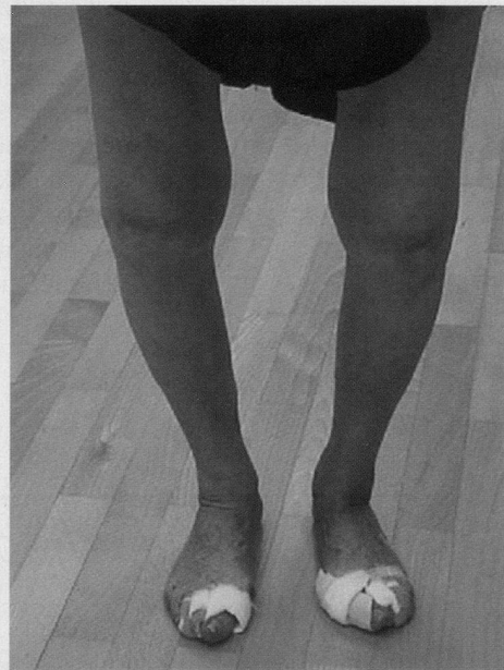
Schwere Kniearthrose (O-Beine).

Beim häufigeren O-Bein wird die innere Kniegelenkhälfte mehr belastet, sie ist deshalb auch öfter von der Arthrose betroffen. Durch den Anbau von Knochen rund um das Gelenk versucht der Körper, die Belastung auf eine grössere Fläche zu verteilen, weshalb arthroti-