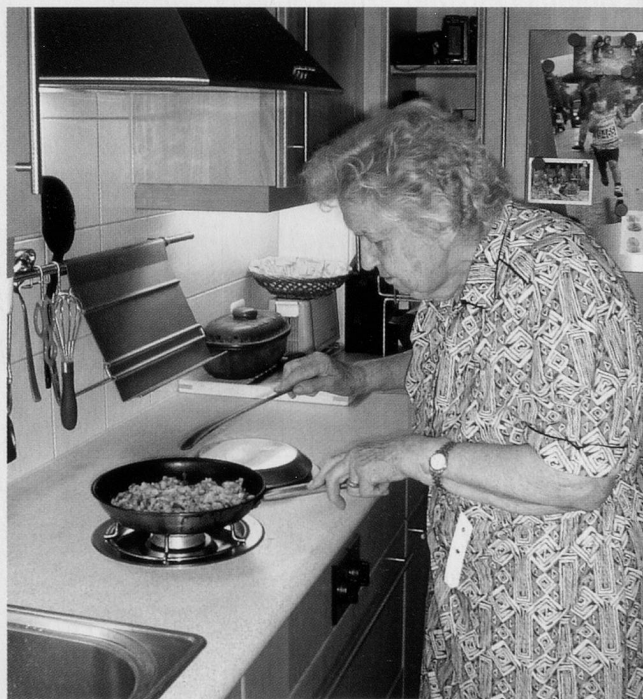
Bringen Sie Abwechslung in Ihre Küche – mit original italienischen Rezepten.

Sizilien, oder das Land, wo die Zitronen blühen