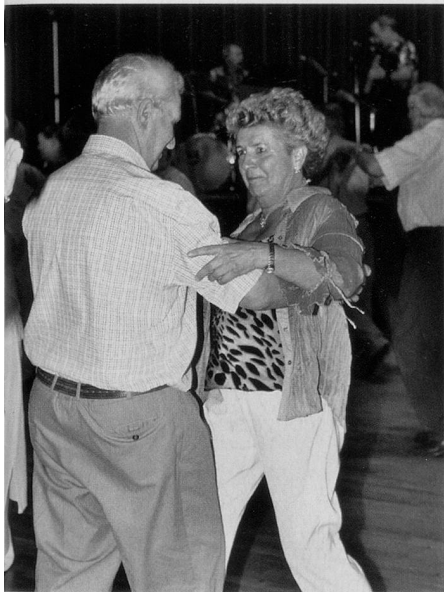
Das Live-Orchester bringt die Tanzpaare in Schwung ...

Am liebsten, so sagen viele, besuchen sie mit einem ständigem Tanzpartner den Tanzanlass, da weiss man, dass man nicht sitzen bleibt, und dass man von einem guten Tänzer geführt wird. Denn der Partner auf dem Parkett und die Musik entscheiden letztlich darüber, ob der Anlass gelingt.