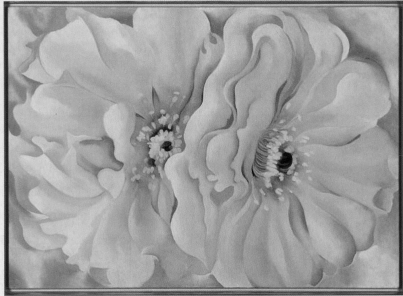
«Scheinen einen Duft zu verströmen: O'Keeffes grossflächige Blumenmotive».