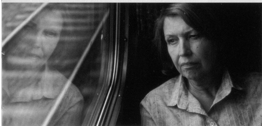
Grossmutter May: Reise in eine unerwartete Zukunft.

Kursbuch 151. Das Alter; Herausgegeben von Ina Hartwig, Ingrid Karsunke und Tilman Spengler; Rowohlt Verlag, Innsbruck. ISBN 3-87134-151-7.