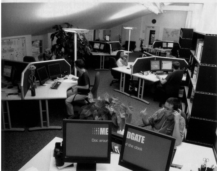
Daten werden auf elektronischem Weg via Telefon übermittelt.

Informationstechnologien in der Medizin. «Es geht mir nicht um die Telemedizin um der Telemedizin willen, sondern um ihre Nutzung in einem sinnvollen Kontext zum Wohl der Patienten», präzisiert er. Er sieht die Arbeit des Beratungszentrums, das seine Dienste rund um die Uhr anbietet, als Ergänzung zu Hausarztpraxen – nicht als Konkurrenz. Auch der Pilot-Charakter des derzeit laufenden Lungenbetreuungs-Projektes gefällt dem Mediziner, der auch im Kantonsspital Basel arbeitet. Es geht darum, die Ergebnisse auch auszuwerten, um «die Prozesse im Gesundheitswesen zu optimieren». Der Kreislauf, gesundheitliche Probleme früh erkennen – sofort eingreifen – Schwierigkeiten minimieren – Spitalaufenthalte reduzieren – dadurch Kosten einsparen – und sich immer wieder neu und eigenverantwortlich für die Gesundheit einsetzen, müsse in Zukunft noch selbstverständlicher werden. Dass diese Arbeit «etwas kostet», liegt für Dr. med. Serge Reichlin bei der Telemedizin auf der Hand.