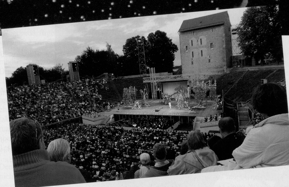
Die Arena in Avenches bietet einen würdigen Rahmen zu Bizets «Carmen».