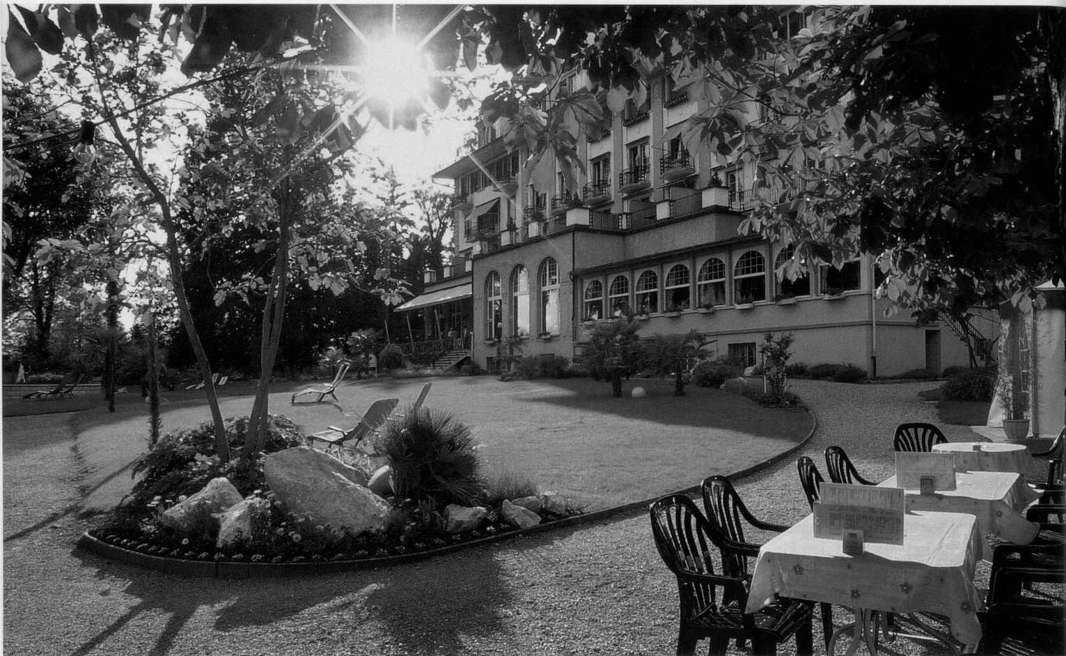
Im Grünen: Majestätische Bäume als Rahmen für das Parkhotel.