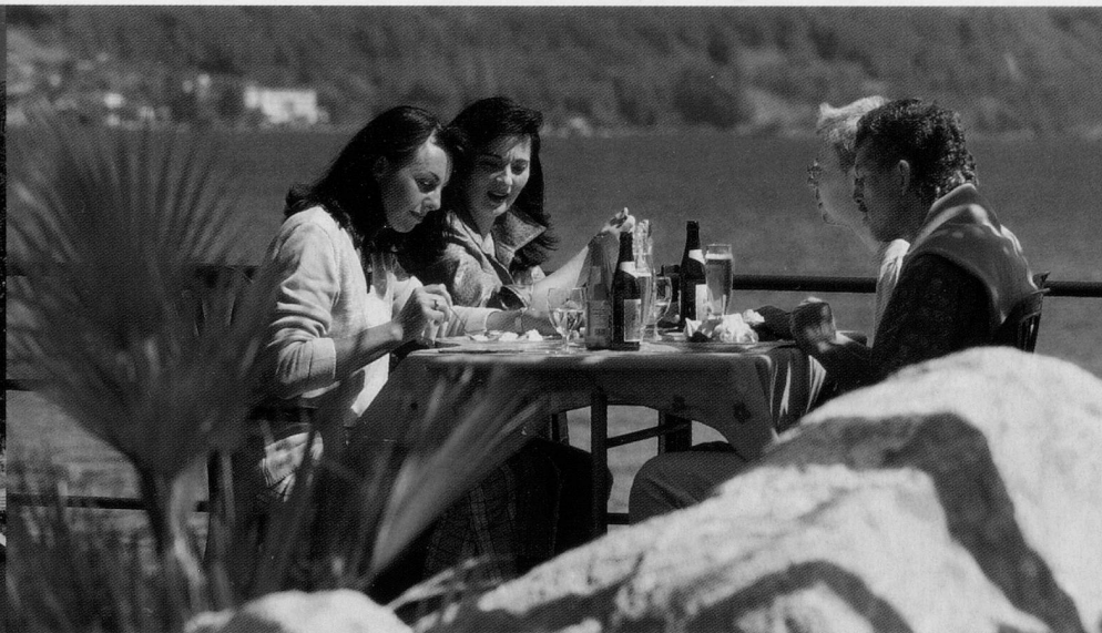
Mediterranes Flair erleben die Gäste auf der Seeterrasse.