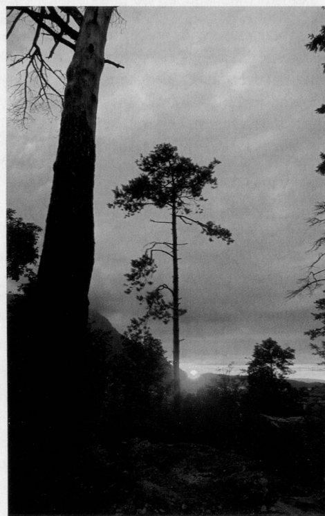
Vom Naturdrama zum Naturerlebnis – der Natur- und Tierpark Goldau zeigt eine Ausstellung zum Bergsturz vor 200 Jahren.

(pd) Im kommenden September jährt sich der Goldauer Bergsturz, eine der folgenschwersten Naturkatastrophen in der Schweiz, zum 200. Mal. Der Natur- und Tierpark Goldau befindet sich mitten auf der Gerölllandschaft, die der Bergsturz hinterlassen hat – und thematisiert darum dessen spektakuläre Folgen mit attraktiven Ausstellungen, Führungen und Veranstaltungen.