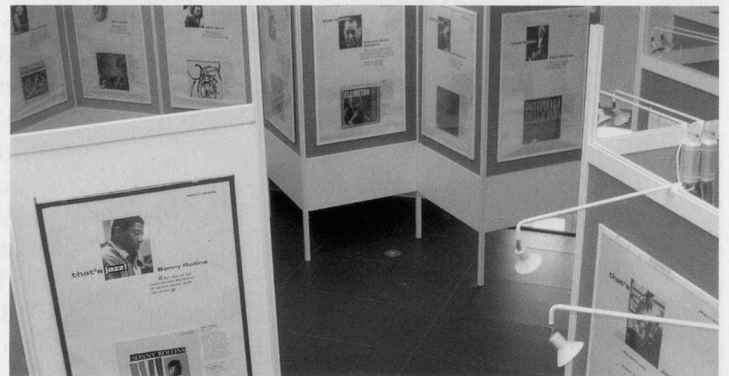
Wechselnde Ausstellungen im SwissJazzOrama dokumentieren die Geschichte des Jazz.

Das Jazz-Museum präsentiert ständig wechselnde Ausstellungen, zurzeit unter dem Titel «Jazzstadt Zürich». Zudem ist im ersten Stock das Exponat «That's Jazz» zu besichtigen, wo 40 berühmte Musiker aus allen Epochen und Stilrichtungen sich zum Thema Jazz zu Wort melden. Dank der spektakulären Fototechnik von 3-D-Motion ist ein virtueller Museumsrundgang bei der nebenan erwähnten Internetadresse jederzeit abrufbar.