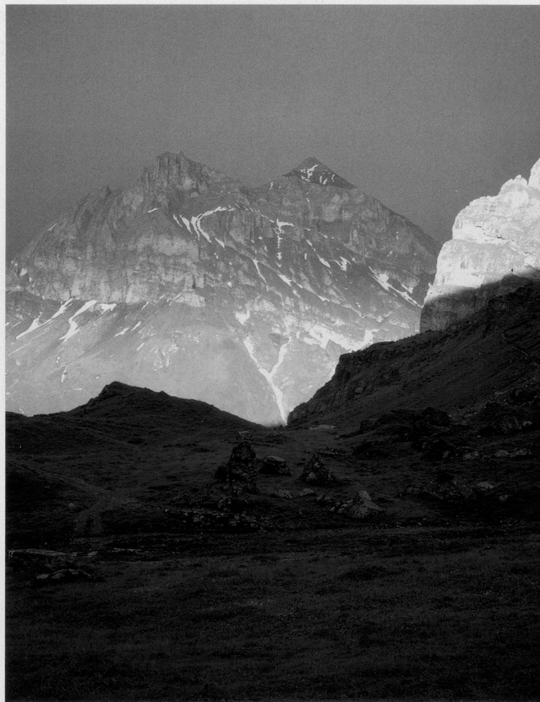
Isenthal Oberalp, Sommer 2005.

Die Ausstellung dauert noch bis zum 5. April 2007.