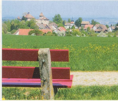
Wandern: Auf zur Kyburg 30