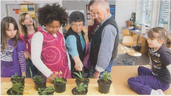
Kräuterkunde: Altes Wissen verzaubert junge Menschen 10