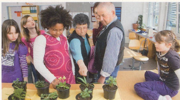
Kräuterkunde: Altes Wissen verzaubert junge Menschen 10