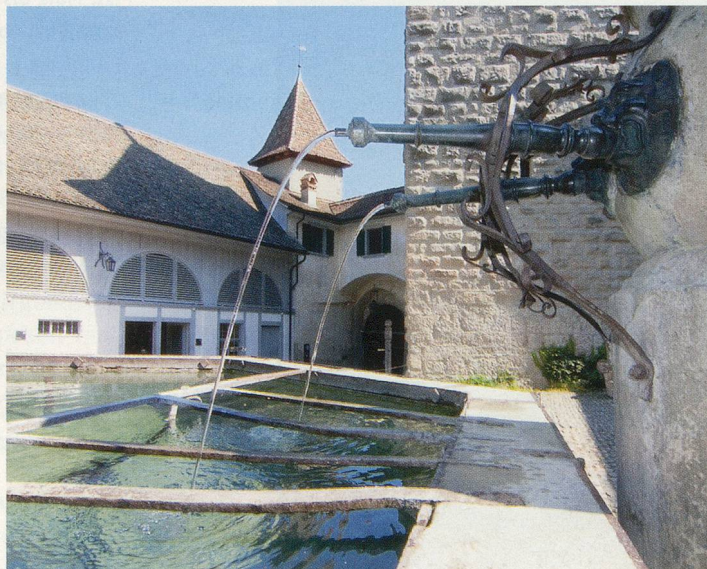
Die mittelalterliche Kyburg gilt als die historisch bedeutendste Burg zwischen Limmat und Bodensee.