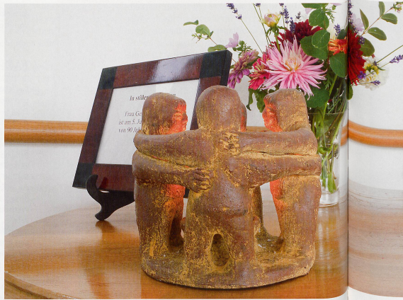
Ein Zeichen, dass im Heim jemand gestorben ist. Ob und wie sich die Anwesenden mit dem Todesfall auseinandersetzen möchten, ist ihnen freigestellt.

Alle vorgestellten Publikationen können in der Bibliothek von Pro Senectute ausgeliehen werden: Tel. 044 283 89 81, bibliothek@pro-senectute.ch , www.pro-senectute.ch/bibliothek