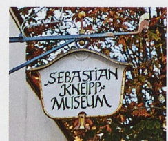
Oben: Sebastian Kneipps Lebenswerk im ortseigenen Museum Links: Kneipp-Armbad

Stöcklin Katalog Im Programm neben Bad Wörishofen auch Abano-Montegrotto, Montecatini und Ischia. Fordern Sie den Stöcklin Katalog 2017 unverbindlich an!