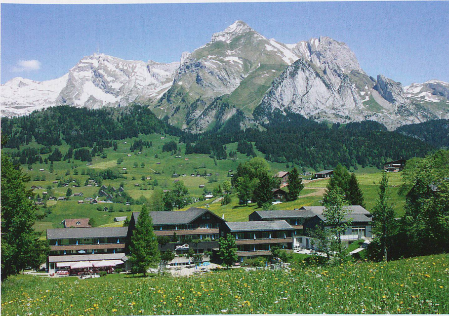
«Stump's Alpenrose», ein besonderer Ort zwischen Seen, Alpweiden und Bergen.