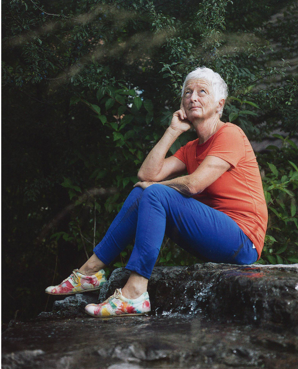
Was passiert mit uns, mit unserer Seele, wenn wir sterben? Die meisten Menschen beschäftigt solche und ähnliche Fragen.

wurde Unvorstellbares messbar. Doch je mehr wir wissen, desto klarer erscheinen offensichtlich auch die Grenzen unseres Denkens.