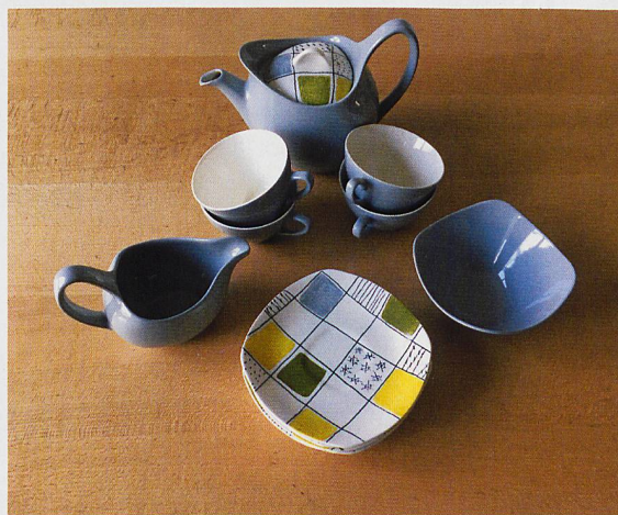
Vom Tee-Set, das die Eltern zu ihrer Hochzeit im Jahr 1960 erhalten haben, hat sich der Autor nicht trennen können.

Da weder meine Geschwister noch mein Vater Einspruch erhoben, packte ich die Musikdose und das Tee-Set in eine Tasche und fand, ich sei mit meinem Plan, möglichst wenig mitzunehmen, ziemlich gut durchgekommen. >>